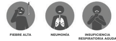
FIEBRE ALTA NEUMONÍA INSUFICIENCIA RESPIRATORIA AGUDA

*Los síntomas podrían aparecer de 1 a 12 días después de la exposición al virus.