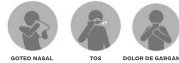
GOTEO NASAL TOS DOLOR DE GARGANTA